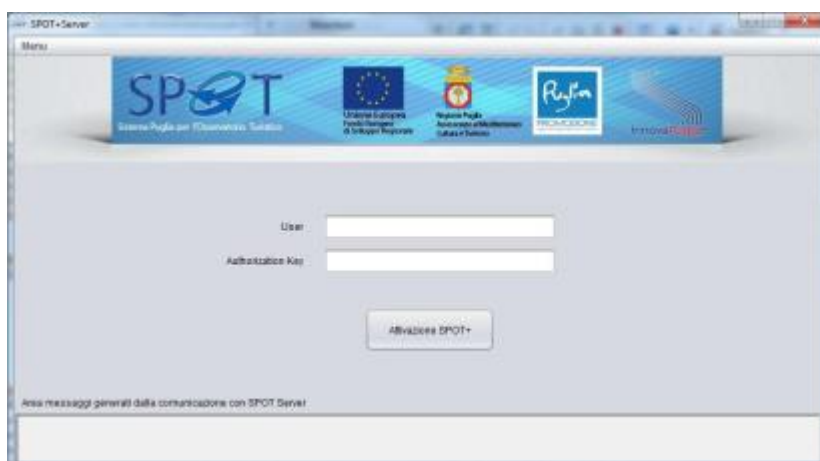
Figura 3- Schermata SPOT+ attivazione

5. In caso di primo utilizzo del programma sul PC, si presenta la schermata seguente: