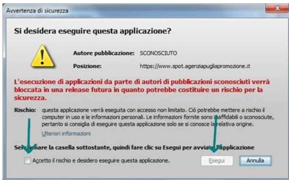
Figura 2 - Avviso certificato