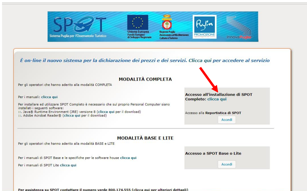
Figura 1 – Pagina per download SPOT+